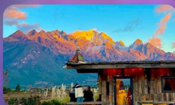
คาเฟ่ Yun Ti Yang