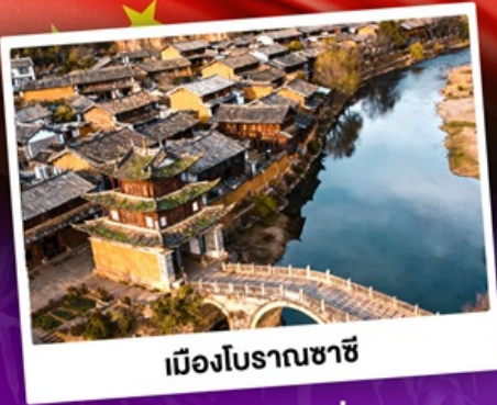
เมืองโบราณชาซี

ชมดอกไม้บานสะพรั่งทั่วยูนนาน "เซ็ดอี่แฉดาเฟ้ววี่สุดอลัง"