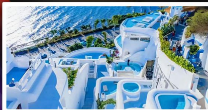
ซาไดร์นี่