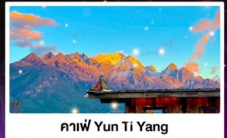
กาแฟ Yun Ti Yang