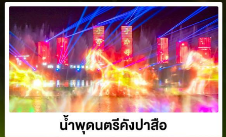
น้ำพุดนตรีคังปาสือ