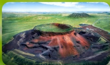
ภูเขาไฟอูลันดา

JINGSHA INTERNATIONAL HOTEL หรือเทียบเท่า 4 ดาว