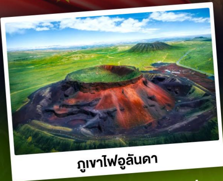
ภูเขาไฟอูลันดา

ท่องเที่ยวแดนแห่งทะเลทรายและทุ่งหญ้า ชมพระอาทิตย์ขึ้นที่ทุ่งหญ้าออร์ดอส