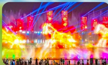
น้ำพุดนตรีคังปาสือ