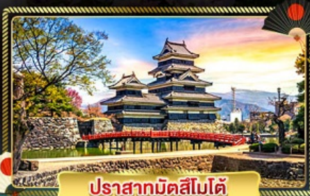
ปราสาทมัตสึโมโต้