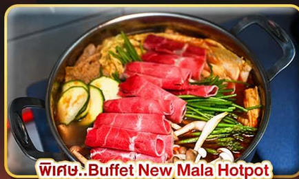
พิเศษ..Buffet New Mala Hotpot Free Flow Beer & Soft Drink