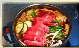
พิเศษ..Buffet New Mala Hotpot Free Flow Beer & Soft Drink