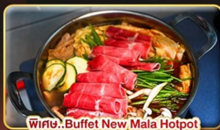
พิเศษ.. Buffet New Mala Hotpot Free Flow Beer & Soft Drink