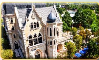
ปราสาทช็อคโกแลตนี้น่า

เมืองไทเป หรือเทียบเท่า 3-4* ตามมาตรฐานไต้หวัน