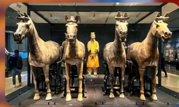
สุสานทหารจิ้นซี