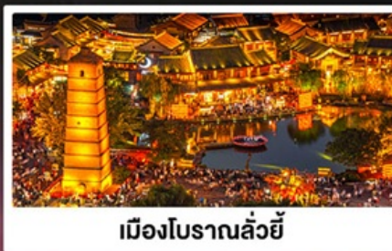
เมืองโบราณลั่วหยี่