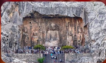
ถ้ำผาหลงเหมิน