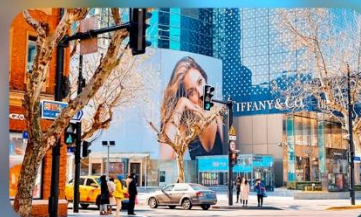
ถนนหอยไทมิดเคิลไรด์