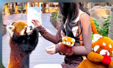
ให้อาหารแพนด้าแดง