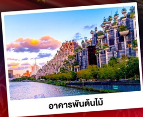
อาคารพินตันไม้