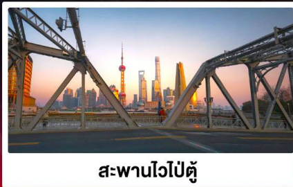
สะพานไวปู้ตู่