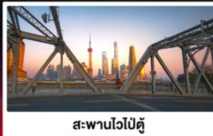
สะพานไวปี้ตู่