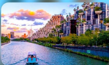
อาคารพินตันไม้

ARTELS COLLECTION / HOLIDAY INN EXPRESS HOTEL หรือเทียบเท่า 4 คาว