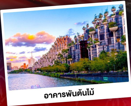
อาคารพินตันไม้

ใกล้ชิดแพนด้าแดงแสนน่ารัก SHANGHAI WILD ANIMAL PARK ชมการแสดงพลุสุดปังที่สวนสนุกดิสนีย์แลนด์