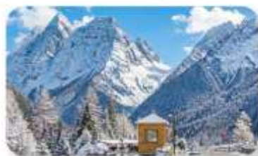
ภูเขาสี่ครุณี