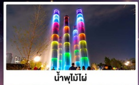
น้ำพุไม้ไฟ