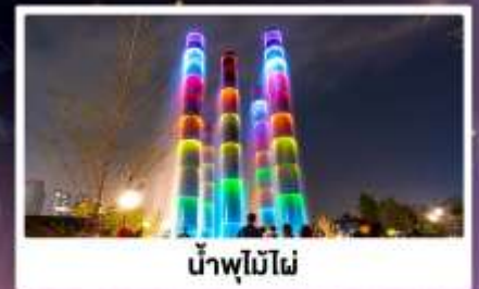
น้ำพุไม้ไฟ