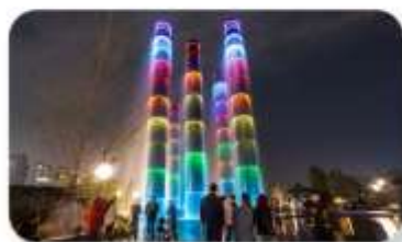
น้ำพุไม้ไผ่