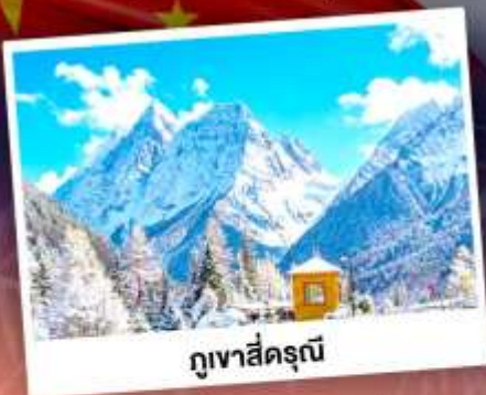
ภูเขาสี่ครุณี

เที่ยว 3 อุทยานสวรรค์แห่งมณฑลเสฉวน ถ่ายรูปเช็คอินน้ำพุไม้ไฟยักษ์ เดินเล่นถนนโบราณ