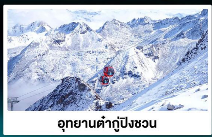
อุทยานต้ากู่ปิงชว่น