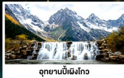
อุทยานปี้ฝิงโกว