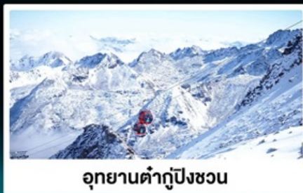
อุทยานต้ากู่ปิงชว่น