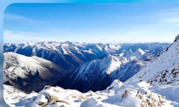
อุทยานคำกู่ปิงชว่น