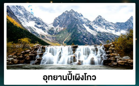
อุทยานปี่ฝิงโกว