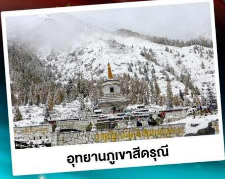
อุทยานกุ๋เจาสีครุณี