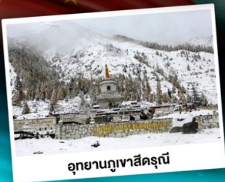
อุทยานกุเวาสีดรุณี

เที่ยว 3 อุทยานสวรรค์ สัมผัสบรรยากาศหน้าหนาว "แดนมังกร"