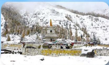
อุทยานกูเวาสีครุณี