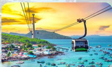
Hon Thom Island