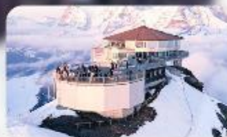
ทานอาหารที่ Piz Gloria ภัตตาคารที่หมุนได้ 360 องศา