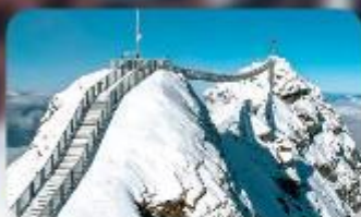
พิชิต 3 ยอดเขาดัง Rigi / Schilthorn / Glacier 3000