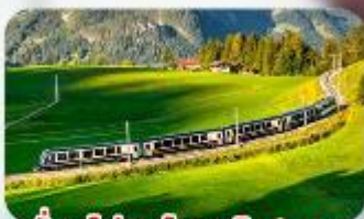
นั้รถไฟสายโรแมนติก 2 สาย Golden Pass / Luzern Interlaken Express