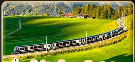
นั่งรถไฟสายโรเมนติก 2 สาย Golden Pass / Luzern Interlaken Express