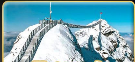
พิชิต 3 ยอดเขาดัง Rigi / Schilthorn / Glacier 3000