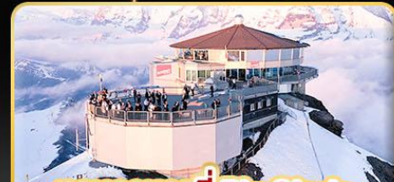
ทานอาหารที่ Piz Gloria ทัศนียภาพที่มองเห็นได้ 360 องศา