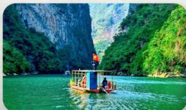
ล่องเรือ Ma Pi Leng Pass

YEN BIEN LUXURY 4* หรือเทียบเท่ามาตรฐานเวียดนาม