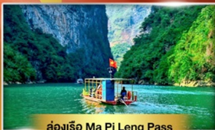
ล่องเรือ Ma Pi Leng Pass

เส้นทางเปิดใหม่ ฮาหยาง เช็คอินเมืองตามด้าว "เวียดนามฟีลยุโรป"