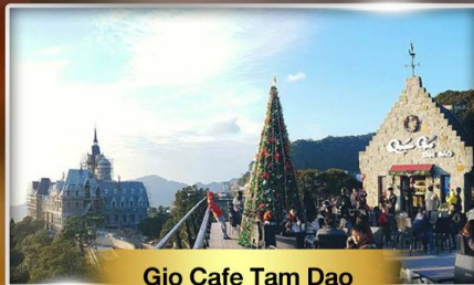
Gio Cafe Tam Dao