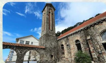
Tam Dao Stone Church