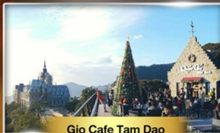
Gio Cafe Tam Dao