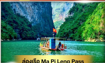
ล่องเรือ Ma Pi Leng Pass

เส้นทางเปิดใหม่ ฮายาง เช็คอินเมืองตามด้าว "เวียดนามฟิลาโรป"