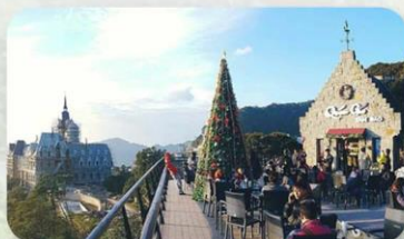
Gio Cafe Tam Dao