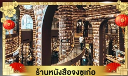
ร้านหนังสือจางชู่เก๋อ

ดินแดนสวรรค์ความสูง 4,860 เมตร "ต้ากู่ปิงชว่น & กู๋เขาสีดรุณี"