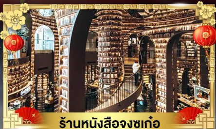
ร้านหนังสือจงซูเก๋อ

ดินแดนสวรรค์ความสูง 4,860 เมตร "ต้ากู่ปิงชว่น & ภูเขาซีครุณี"