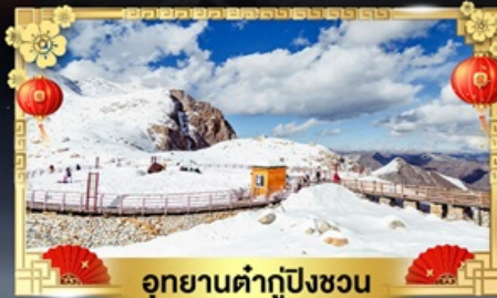
อุทยานต้ากู่ปิงชว่น