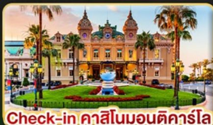
Check-in คาสิโนมอนติคาร์โล