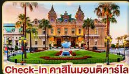
Check-in คาสิโนมอนติคาร์โล