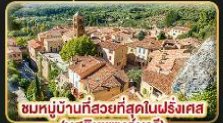
ชมหมู่บ้านที่สวยงามที่สุดในฝรั่งเศส (มูสติเยแซงมารี)