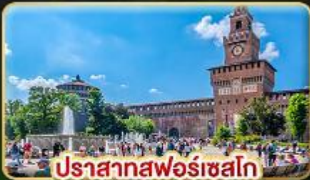
ปราสาทฟอรัสเซโก