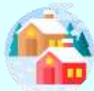
เมืองเซอร์แมท

เช้า บริการอาหารเช้า ณ ห้องอาหารของโรงแรม (11)