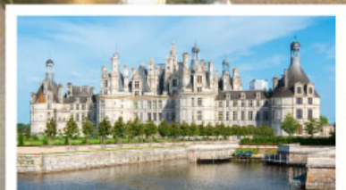
เข้าชมพระราชวังช็องบอร์