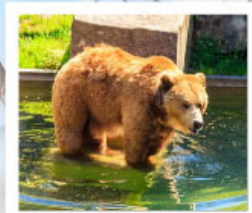
บ่อหมีเมืองเบิร์น