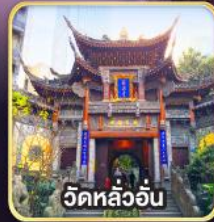
วัดหลวอัน