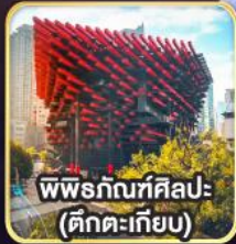
พิพิธภัณฑ์ศิลปะ- (ตึกตะเกียบ)