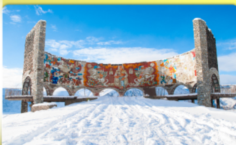
อนุสรณ์สถานรัสเซีย