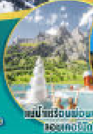
หมู่บ้านชโรนฟองทะเลสาบ ออลเทาสธอร์น