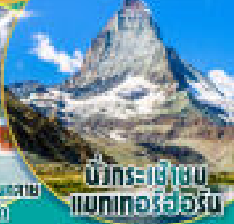
ขึ้นกระเช้าชม แมทเทฮอร์น