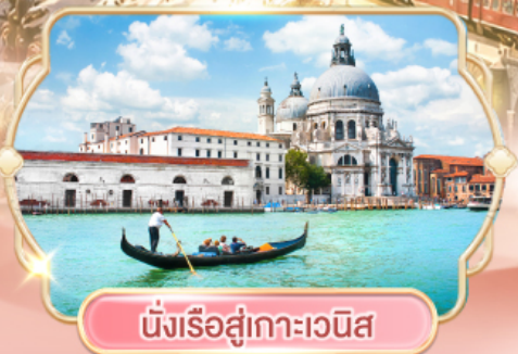
นั่งเรือสู่เกาะเวนิส