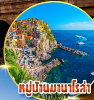
หมู่บ้านมานโรซ่า

พิเศษ ลิ้มรสปาร์มาแฮมถึงเมืองต้นกำเนิดแท้ๆ