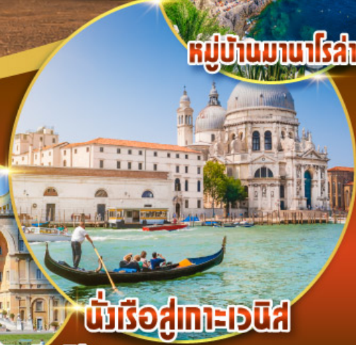
นั่งเรือสู่เกาะเวนิส