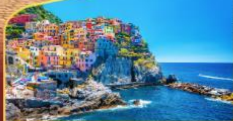
หมู่บ้านมานาโรล่า