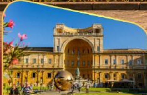
เข้าชมพิพิธภัณฑ์วาติกัน