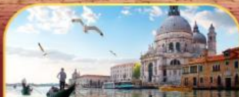
นั่งเรือสุทเกาะเวนิส