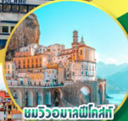
ชมวิวมอลฟีโคสตี