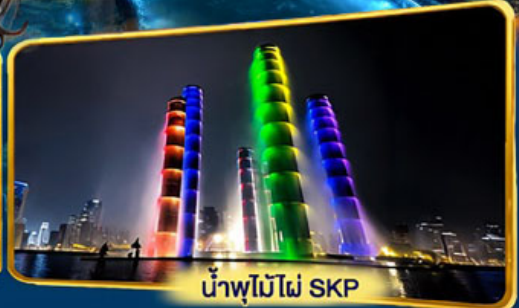
น้ำพุไม้ไฟ SKP