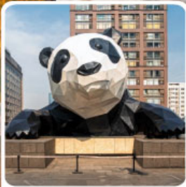
หมีแพนด้ายักษ์ป็นตึก