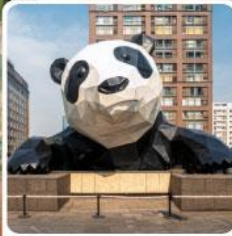
หมีแพนด้ายักษ์ป็นตึก