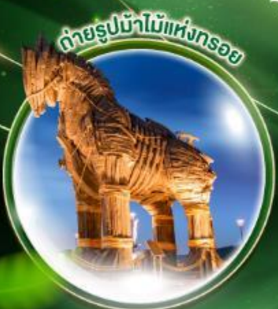
ถ่ายรูปล้ำไม้แห่งทรอย