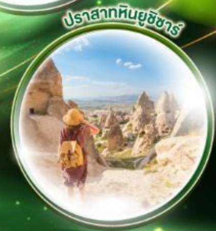
ปราสาทหินยูซซาร์