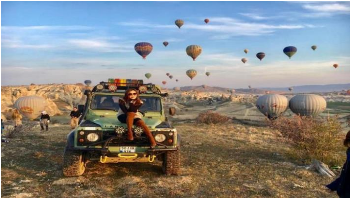
3. Classic Car นั่งรถคลาสสิก เปิดประทุน สูดอากาศ เย็น สดชื่น พร้อมชมบอลลูนสีสดใส วิวเมือง คัปปาโดเกีย ค่าใช้จ่าย 120 USD / ท่าน