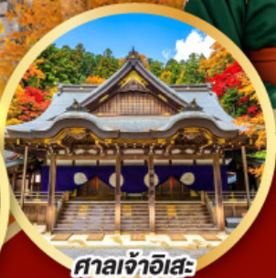
ศาลเจ้าอิเสะ