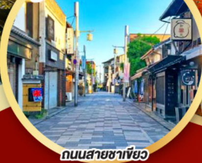
ถนนสายชาเขียว