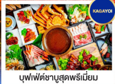
บุฟเฟ่ต์ชาบูสุดพรีเมียม