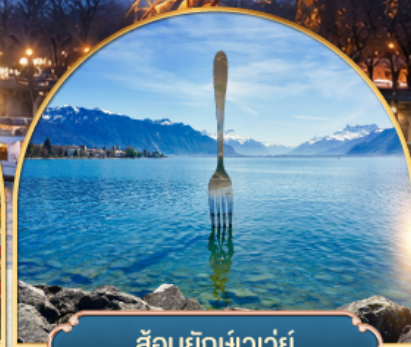
ล้อมยักซ์เวอว์