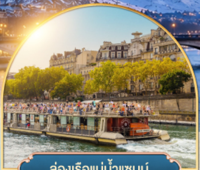
ล่องเรือแม่น้ำแซนน์