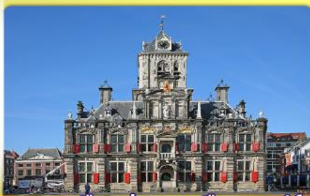
อาคารเมืองเก่าคลองเมืองเคลฟท์