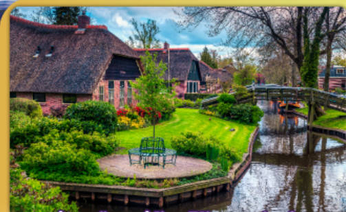
ล่องเรือหมู่บ้านไรทอนท์ธูร์น