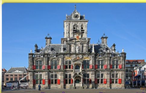
อาคารเมืองเก่าคลองเมืองเคลฟท์