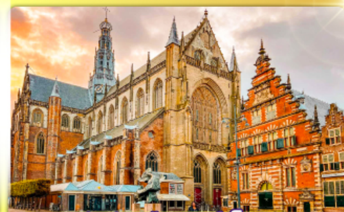
จัตุรัสเมืองฮาร์เล็ม

พรมแดนเมืองแปลกเนเธอร์แลนด์และเบลเยียม เคนเมืองเคลฟท์ เมืองเครื่องปั้นดินเผาระดับโลก ฮาร์เล็มเมืองมั่งคั่งที่สุดของเนเธอร์แลนด์