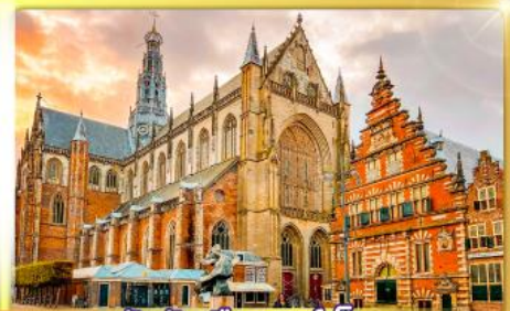
จัตุรัสเมืองฮาร์เล็ม

พรมแดนเมืองเปลาเกเนเธอร์แลนด์และเบลเยียม เติมนเมืองเคลฟท์ เมืองเครื่องปั้นดินเผาระดับโลก ฮาร์เล็มเมืองมั่งคั่งที่สุดของเนเธอร์แลนด์