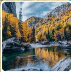
เคอเคอทัวไห่