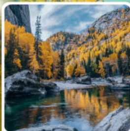
เคนเคอทัวให้อัจฉริยะภูพาน