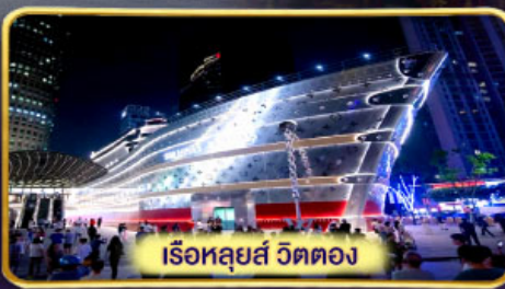
เรือหลุยส์ วิตตอง