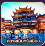
ตลาดฉินหวงเมี่ยว