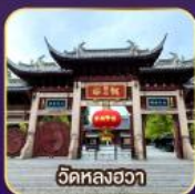
วัดหลงอา