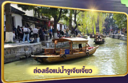
ล่องเรือแม่น้ำจูเจียงเจี๋ยว