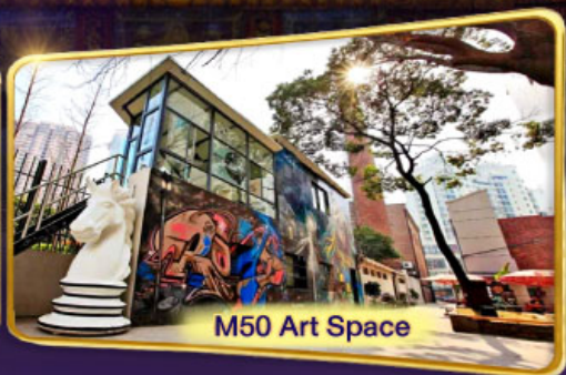
M50 Art Space