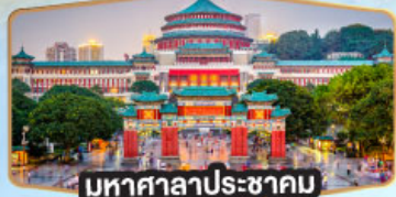
มหาศาลาประชาชน