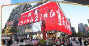
ถนนคนเดินถวณอันเฉียว