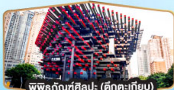
พิพิธภัณฑ์ศิลปะ (ศิลปะเก๋)