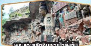
พระแกะสลักหินเขาป่าตึงซัน