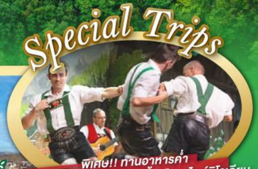
พิเศษ!! ทานอาหารค่ำ พร้อมชมการแสดงดนตรีพื้นเมืองสไตร์ทโรเลียน และเยือนเมืองอูเทรคต์ สีสันใหม่เนเธอร์แลนด์