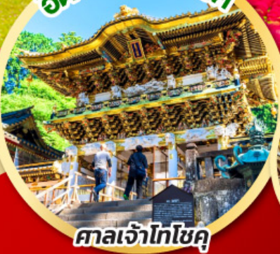
ศาลเจ้าโทโซคุ