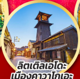
ลิตเติลเอโดะ เมืองคาวาโกเอะ