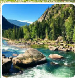
อุทยานเคอเคอทัวไห่