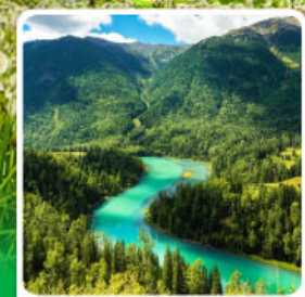
ทะเลสาบคานาสีอ