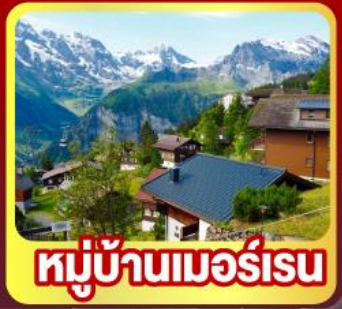
หมู่บ้านเมอร์สเรน