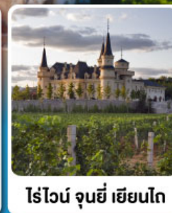
ไร่ไวน์ จุนยี่ เยียนโก