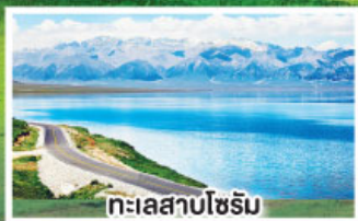
ทะเลสาบโซรัม