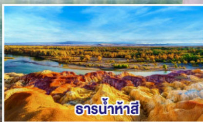
ธารน้ำห้ำสี