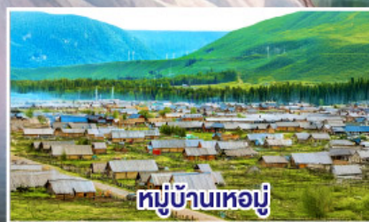
หมู่บ้านเหมอู๋