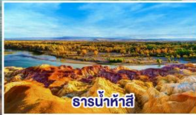
ธารน้ำห้าสี