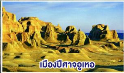
เมืองปีศาจจวูเทอ