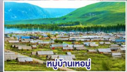
หมู่บ้านห่มู