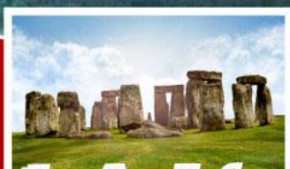
เยือนสโตนเฮ็นจ์ และ พิพิธภัณฑที่โรมันบาร