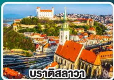
ปราตีสลาวา