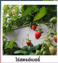
ไร่สตอร์วเบอร์รี่