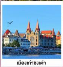
เมืองเก่าชิงเต่า