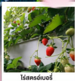
ไร่สตรอว์เบอร์รี่