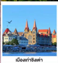
เมืองท่าชิงเต่า

ละมุนกลิ่นสตรีอว์เบอร์รี่ เบียงไถ เว่ย์ไห่ จีหนาน