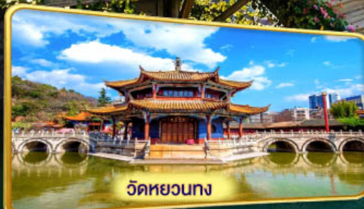
วัดหยวนกง