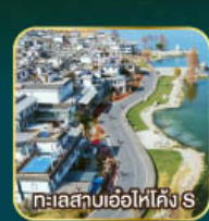
ทะเลสาบเอ๋อไห่โค้ง S