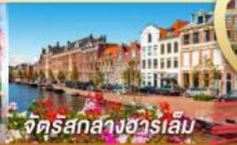
จัตุรัสกลางฮาร์เล็ม