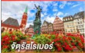
จัตุรัสโรเมอร์