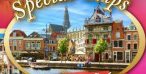
เก็บครบเบนลักซ์ แะที่ฮาร์เล็ม