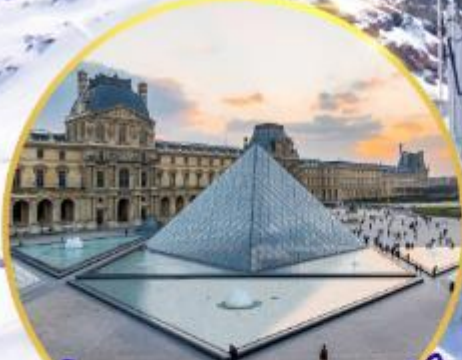
ถ่ายรูปคู่พีพีรภัทท์ที่ลูฟท์