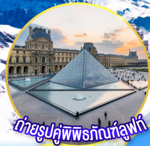
ถ่ายรูปคู่พีพีร์กันที่ลูฟร์