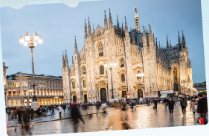
คูโอโม มิลาน