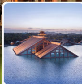
พิพิธภัณฑ์ไดน้ำกวางฟู่หลิน