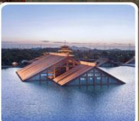
พิพิธภัณฑ์ไดน้ำกงฟู่หลิน