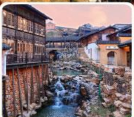
เมืองโบราณเหย่าหู