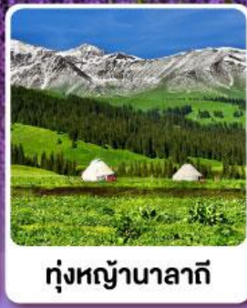
ทุ่งหญ้านาลาติ