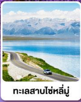
ทะเลสาบไซไห่หลู่