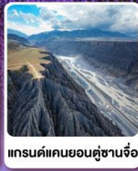
แกรนด์แคนยอนตูซันจื่อ