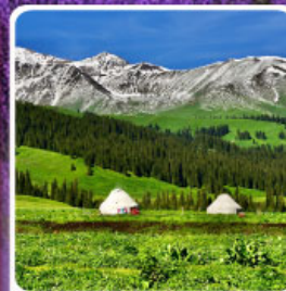
ทุ่งหญ้านาลาติ