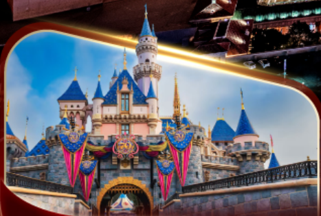
ดิสนีย์แลนด์พาร์ค