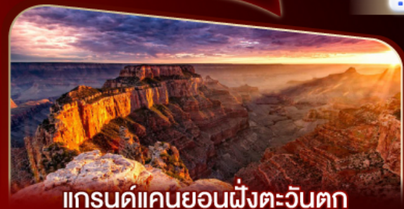
แกรนด์แคนยอนฝั่งตะวันตก

พิกลาสเวกัส 2 คืน เต็มอิ่มกับแสงสีแห่งอเมริกา