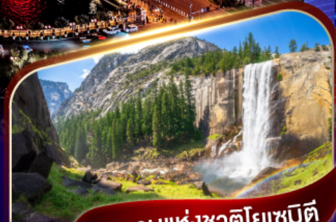
อุทยานแห่งชาติโยเซมิตี